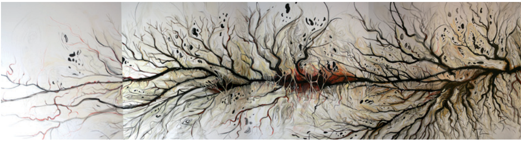
Rohini Devasher: Panoramafotografie des Wandgemäldes „Parts Unknown“ am Max-Planck-Institut

ganisation von Mustern, Formationen und Formbeziehungen zu einem eher neuen Interesse an Prozessen des Emergierens und an Emergenzverhalten.